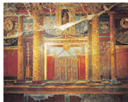
Oplontis, Villa di Poppea, esempio di pittura del quarto stile.

Se nella produzione artistica greca della seconda metà del IV sec. a.C., la pittura – per