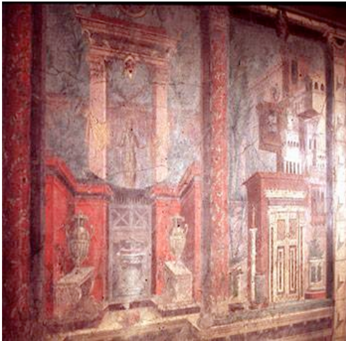
Boscoreale, Villa di P. Fannio, esempio di 'secondo stile'.

A questa fase risalgono le prime pitture di paesaggio e le grandi rappresentazioni (megalografie) ispirate ai racconti mitici e alle decorazioni monumentali degli spazi pubblici. Dallo sfondamento scenografico delle pareti si passa, nella fase finale (30-20 a.C.), a un irrigidimento delle strutture architettoniche, sostituite da composizioni vegetali e arricchite da numerosi motivi ornamentali.